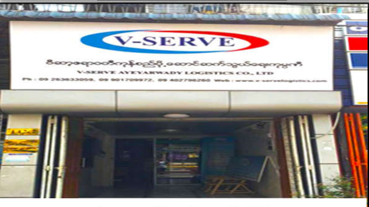
Yangon City Branch Office