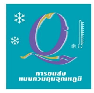
Q-COLD CHAIN TRANSPORT STANDARD

Quality Standards for Agricultural Products and Food Temperature Control